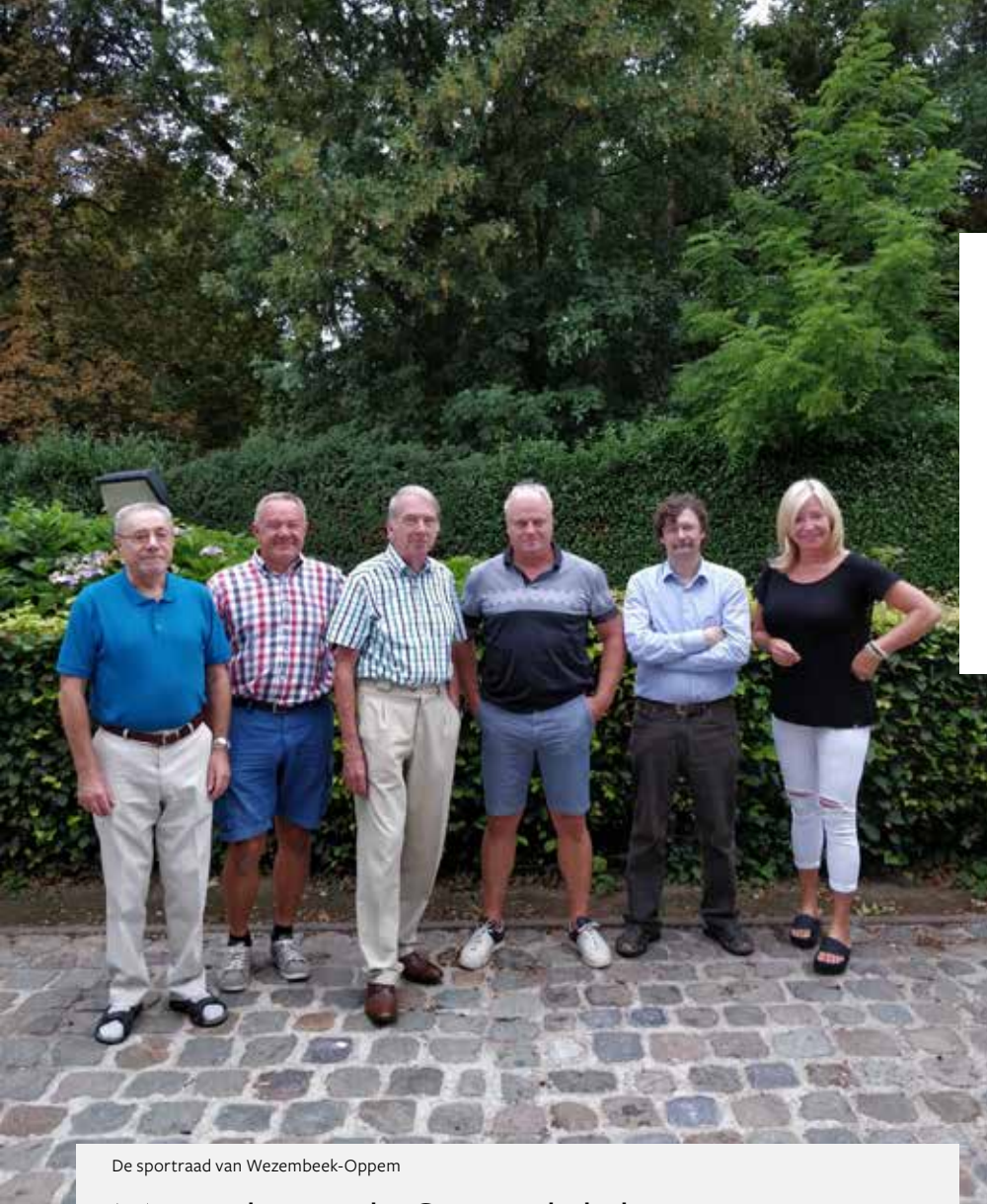
De sportraad van Wezembeek-Oppem