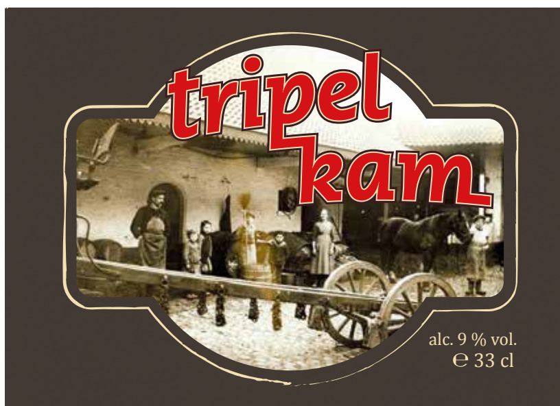
Een voorsmaakje van het Tripelkam-etiket