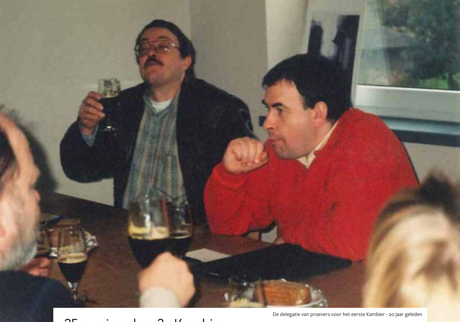
De delegatie van proevers voor het eerste Kambier - 20 jaar geleden