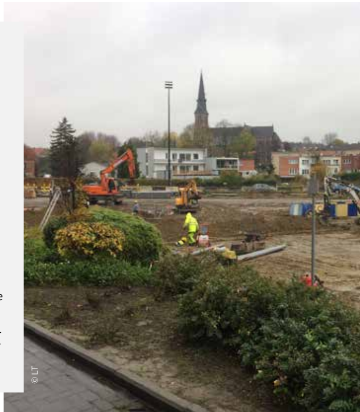
De werken op de Leuvensesteenweg, grondgebied Zaventem, zorgen voor de vertraging.