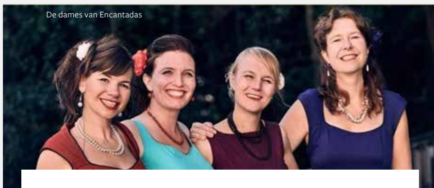
De dames van Encantadas