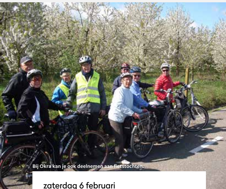
Bij Okra kan je ook deelnemen aan fietstochten.