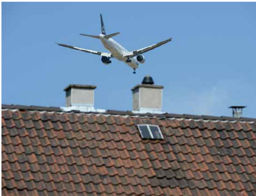
Motie tegen vliegtuiglawaai

> Het retributiereglement voor de blauwe zone wordt toegepast vanaf