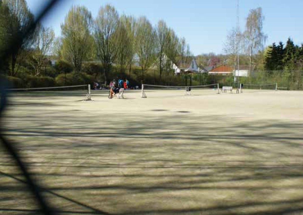
De tennisvelden aan de sporthal zijn aan vernieuwing toe.

> Er komen variabele zone 30-borden op zonne-energie aan de scholen. Daarnaast worden er borden geplaatst die oplichten bij naderend verkeer, in de Louis Marcellisstraat ter hoogte van de Wezembeeklaan en in de Maurice Cesarlaan ter hoogte van de Schone Luchtlaan.