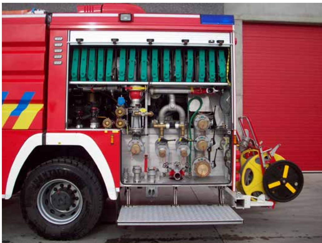
De gemeenten van de Vlaamse Rand zullen moeten betalen als ze een beroep doen op de Brusselse brandweer.