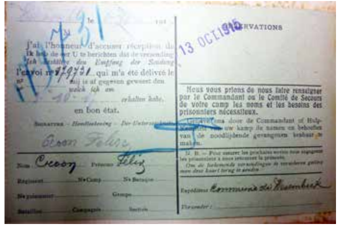
Ontvangstbewijs voor het afleveren van een voedselpakket

krijgsgevangenen. De geïnterneerden worden min of meer als deserteurs beschouwd, die het leven aan het front zijn ontkomen. In de heldenhulde die de oud-strijders na de oorlog krijgen, worden zij slechts ten dele betrokken. Dat ook zij ontbering, kou en honger geleden hebben, wordt niet beschouwd als equivalent met wat de echte soldaten aan het front hadden doorstaan.