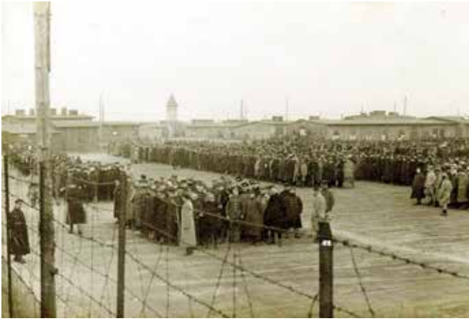
Ochtendappel in het kamp Soltau in Duitsland (14 april 1918)