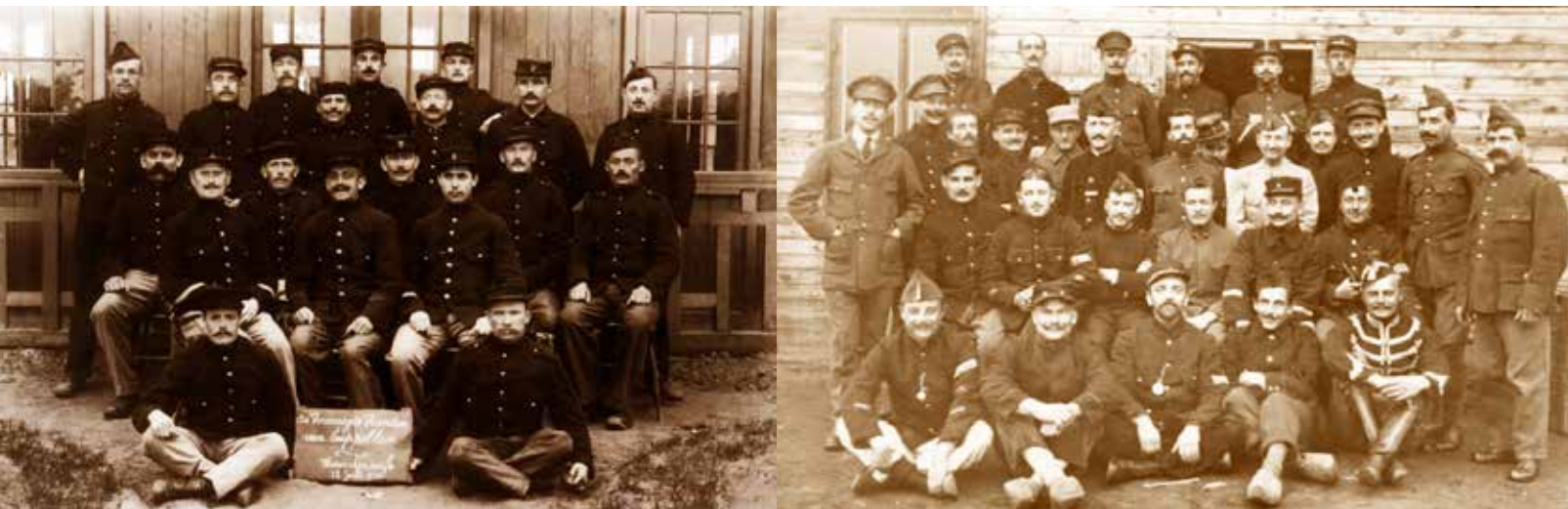
Belgische soldaten (de verenigde vrienden van Kapellen) in kamp Haarderwijk in Nederland