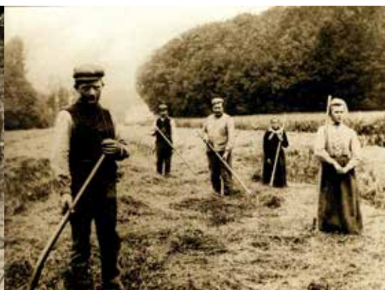
Oogst in het park van het kasteel van Wezembeek in augustus 1916

winkel aankopen doen. Wie zonder inkomen zat, kreeg af en toe een gratis pakket of kon dagelijks naar de soepkeukens gaan voor brood en soep. Kinderen kregen maaltijden uitgereikt op school en er waren speciale programma's voor zuigelingen. Om het sluiten van de scholen – wegens gebrek aan verwarming – te voorkomen, stuurde de gemeente op 4 december twee vrachtwagens naar Charleroi, om kolen.