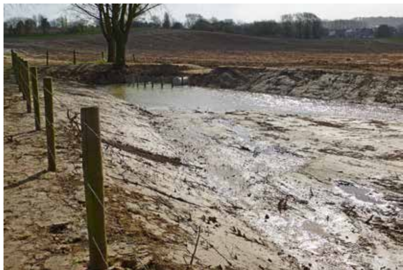
Gemeente ondertekent samenwerkingsovereenkomst tegen erosie.

> De gemeente ondertekent de samenwerkingsovereenkomsten 'opmaak erosiebestrijdingsplan' en 'erosiecoördinator'. Het erosiebestrijdingsplan wordt gesubsidieerd door de Vlaamse Gemeenschap en uitgevoerd door de provincie Vlaams-Brabant. Het omvat een gebied van 192 hectare.