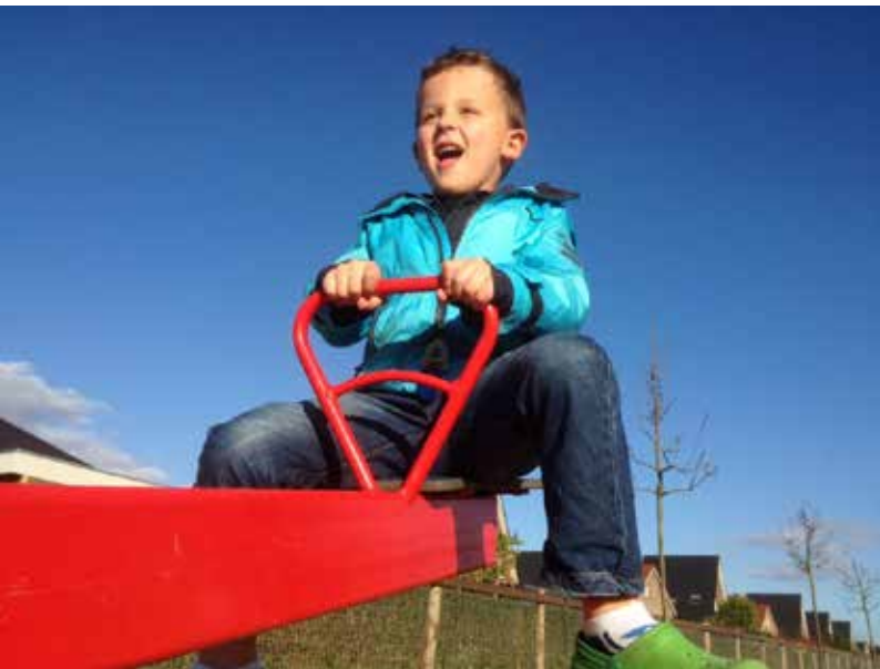
In Ban Eik worden speeltoestellen geplaatst.

college van 4 oktober 2013. Dat betekent acht maanden wachten. Volgens de wet moeten de notulen van een schepencollege worden goedgekeurd op het volgende schepencollege, waarna ze naar de gemeenteraadsleden moeten worden verstuurd. 'Wij vragen ons af of het schepencollege wel met goedgekeurde notulen werkt? Of werkt het zonder? Er bestaat een andere, snelle oplossing: de aanstelling van vijf gemeenteraadsleden om de notulen te laten versturen', grapt WOplus. Volgens schepen Geerseau (LB-Union) werkt het college met goedgekeurde en getekende notulen. 'Ze worden doorgestuurd naar de diensten. Meer uitleg kan ik niet geven.' Waarop raadslid Walraet (WOplus): 'De beslissingen worden dus geprint en getekend en aan de diensten gegeven? Waarom kan dat niet voor de gemeenteraadsleden? De beslissingen van het schepencollege hebben rechtsgevolg. Door de notulen niet aan de gemeenteraadsleden te geven, onttrekt u ze aan mogelijke klachten.'