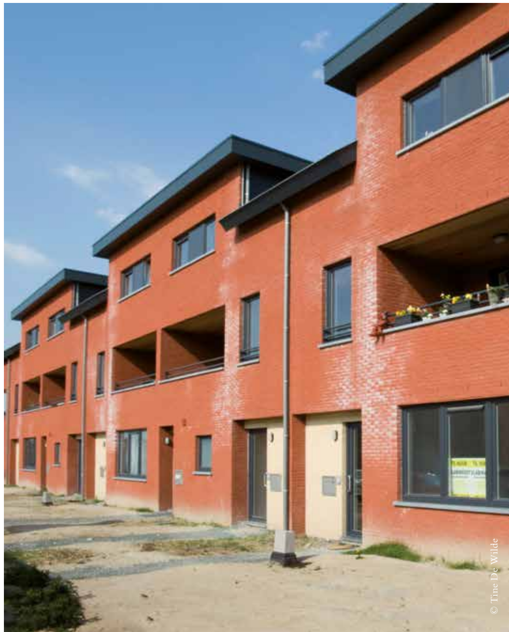
Sociale woningen Kuikenpad, tussen de Kuikenstraat en de Krekeldries in Drogenbos (foto uit 2011)

Van alle gemeenten in de regio Halle-Vilvoorde kwamen er echter 28 in categorie 2b terecht. Zij hadden amper of helemaal geen plan van aanpak. 'Na het beoordelen van bijkomende informatie komen we tot 8 gemeenten waarvoor de Vlaamse Regering een sociale woonorganisatie zal zoeken om hun bindend sociaal objectief te realiseren. Deze gemeenten zijn: Beersel, Drogenbos, Galmaarden, Lennik, Linkebeek, Sint-Genesius-Rode, Wemmel en Wezembeek-Oppem.' Het gaat niet om hoeveel sociale huurwoningen de gemeenten nu al hebben – Wezembeek-Oppem heeft er