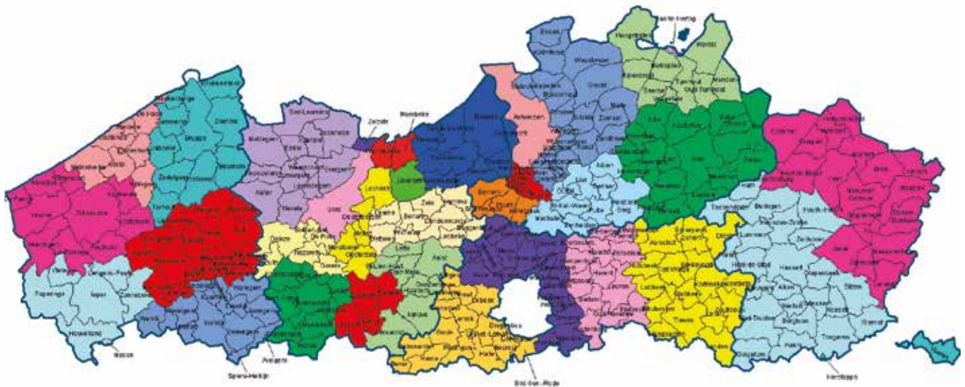
Clusters van gemeenten die minstens 50% dezelfde samenwerkingsverbanden delen.