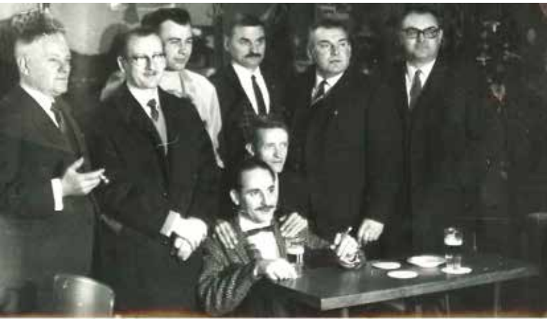
Het KSC Sprint-bestuur anno 1970.