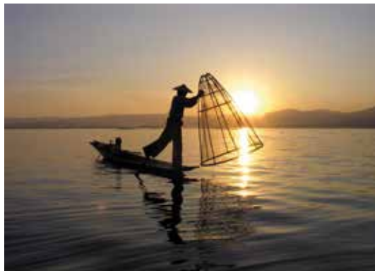
Foto- en filmvoorstelling Myanmar, het vergeten paradijs zaterdag 13 oktober 20 uur – GC de Kam

Myanmar, het vroegere Birma, opent zich langzaam maar zeker voor onze Westerse wereld. Vier globetrotters van OLCO trokken doorheen dit onbekende maar ongelooflijk boeiend land van Boeddha, Aung San Suu Kyi en duizenden gouden pagodes. Hun reisverhaal kan je live meevolgen tijdens de foto- en filmvoorstelling. De opbrengst van deze avond gaat integraal naar het weeshuisproject Hogar Esperanza van zuster Lucienne in Chillan (Chili), een uniek project dat OLCO al jaren steunt. Twee jaar geleden werd dit weeshuis zwaar getroffen door de felle aardbeving in deze regio.