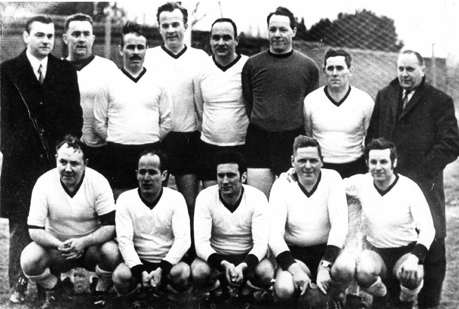
De veteranen van Wezembeek -Oppem.