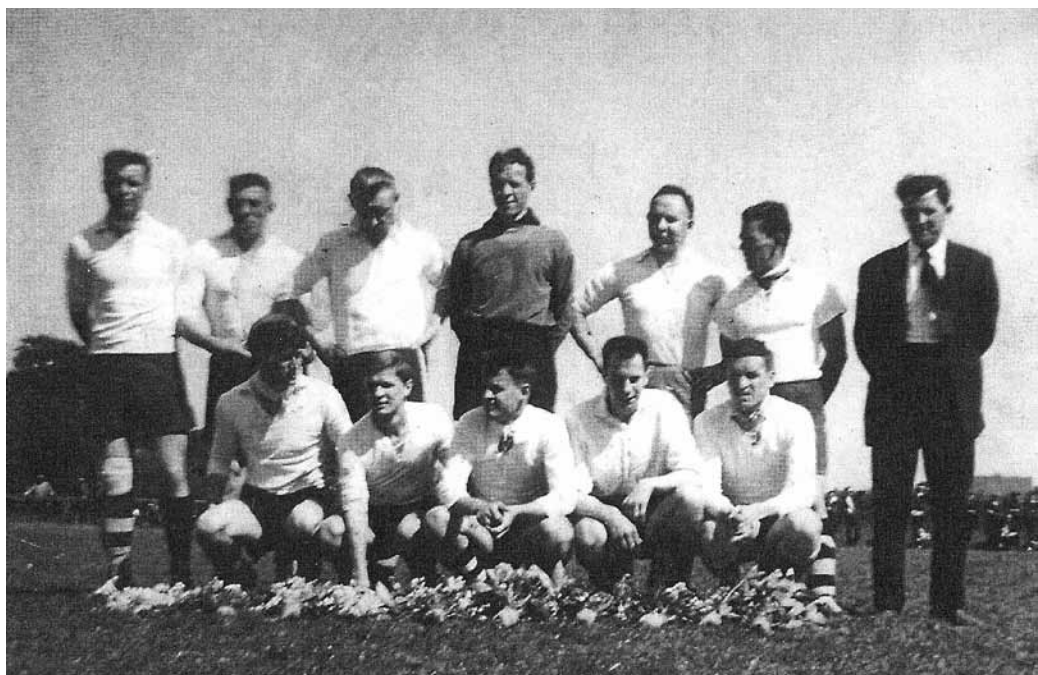
FC Wezembeek kampioen in 1958.