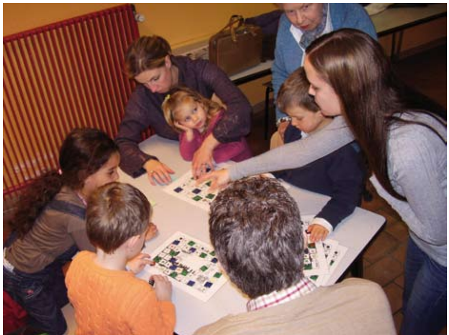
Het achtste en laatste kinderatelier is een interactief toonmoment voor en met de ouders.