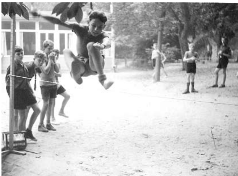
Spelen aan de Vosberg.

terugkerende feest in november begon steevast met een misviering. Daarna zakten we allemaal samen af naar Berkenheem om rond de warme kachel koffiekoeken te eten, met echte chocolademelk.'