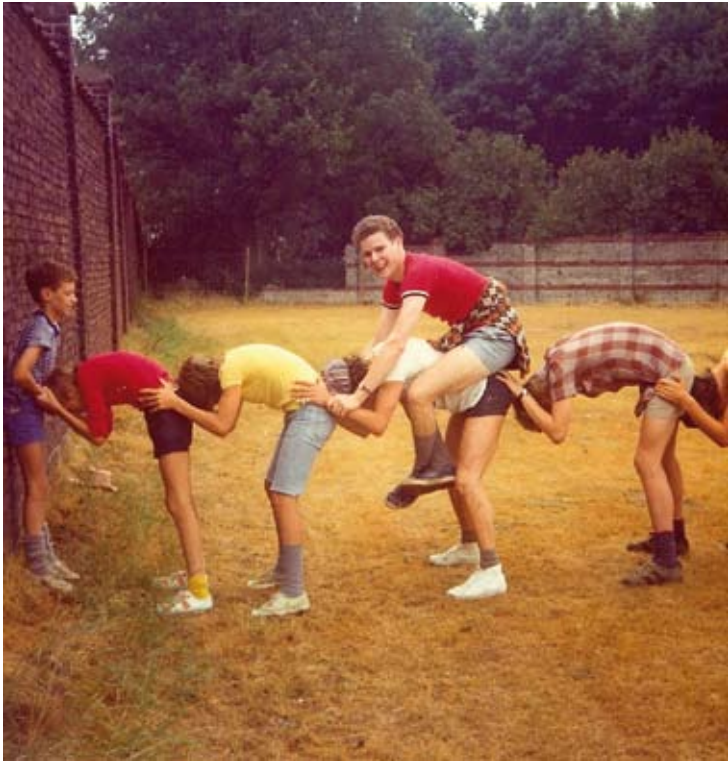
Bivak Bree: haasje over.

avontuur ook na vijftig jaar bestaan? Daar zijn ze van overtuigd.