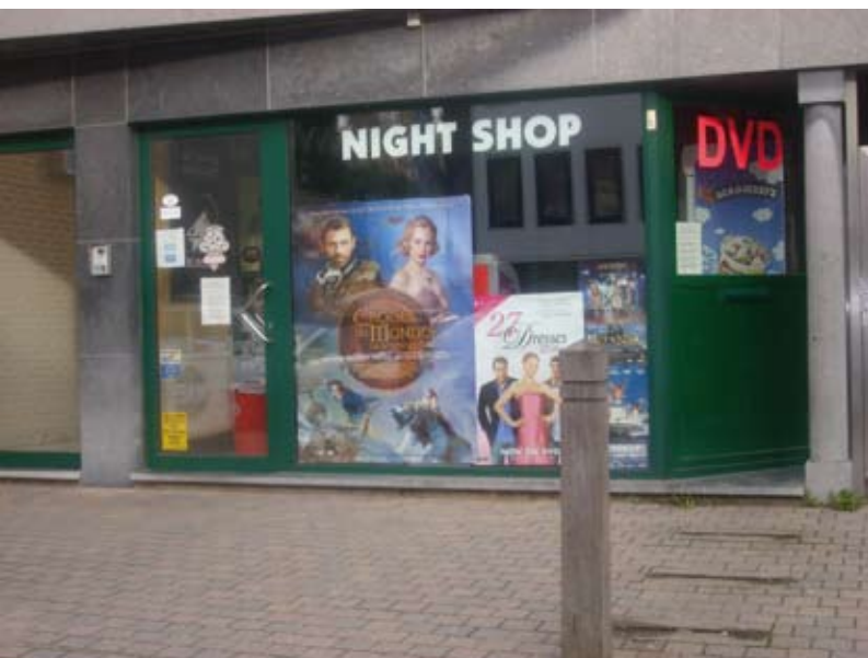
De nachtwinkel op de Varkensmarkt zorgt voor heel wat overlast.