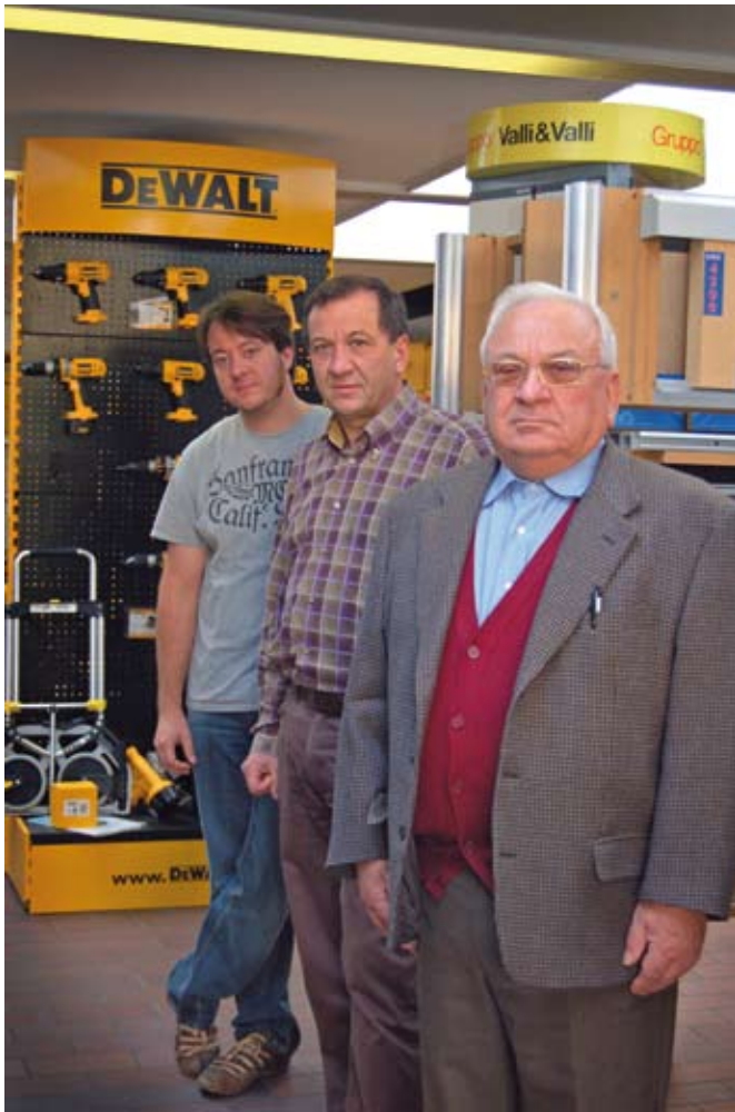
'Vakmannen moet je geen materiaal verkopen dat niet geschikt is om elke dag te gebruiken.'