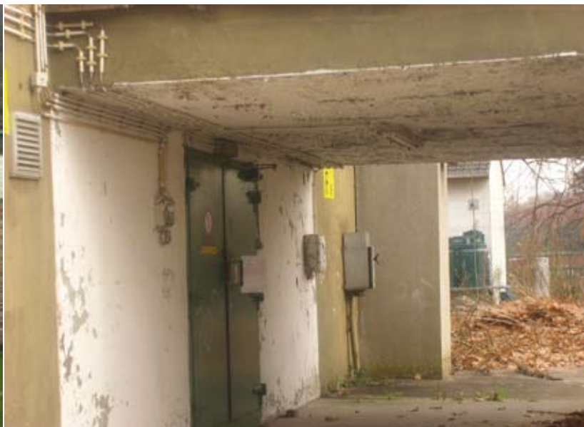
Schepen Petit beweert dat de gemeente hier niets mee te maken heeft.