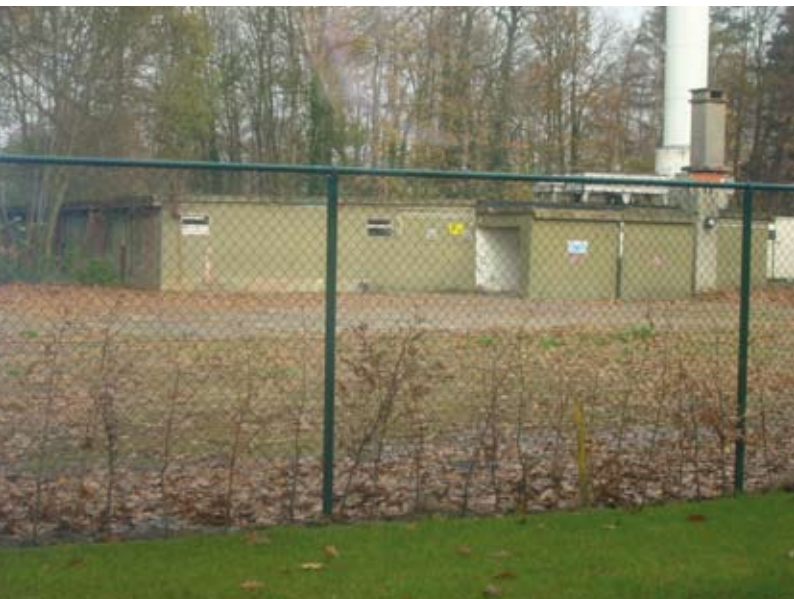
In de bunker naast het nieuwe politiegebouw werden schadelijke stoffen gevonden.

> In de bunker naast het nieuwe politiegebouw werden schadelijke PCB's en zwavelzuur gevonden. De rookmelders met radioactief materiaal werden al weggehaald. Een leiding naar de stookolietank van 30.000 liter lekt. 'Wie zal voor de saneringskosten opdraaien: de gemeente of de vorige eigenaar het ministerie van Landsver-