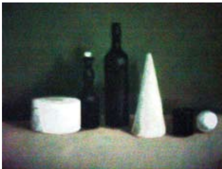
In de cafetaria van GC de Kam Toegang: gratis

Ze is lid van de De Kunstkring Wezembek-Oppem en neemt deel aan hun jaarlijkse tentoonstelling.