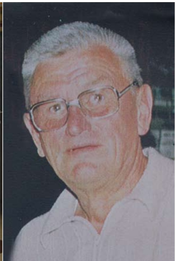
Marcs vader die na de dood van Leopold de zaak overnam.