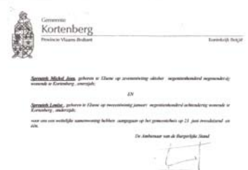
Wettelijk samenwoningsovereenkomst (2001)