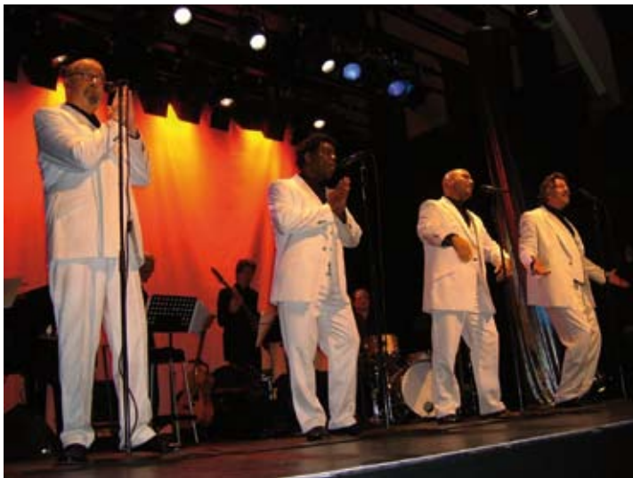
The Deep River Quartet.

Meer daarover in een volgende uitgekamd.