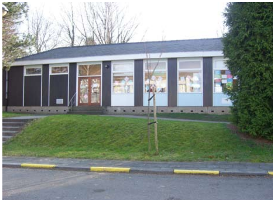
De gemeente wil subsidies voor de renovatie van de gebouwen van De Letterbijter.