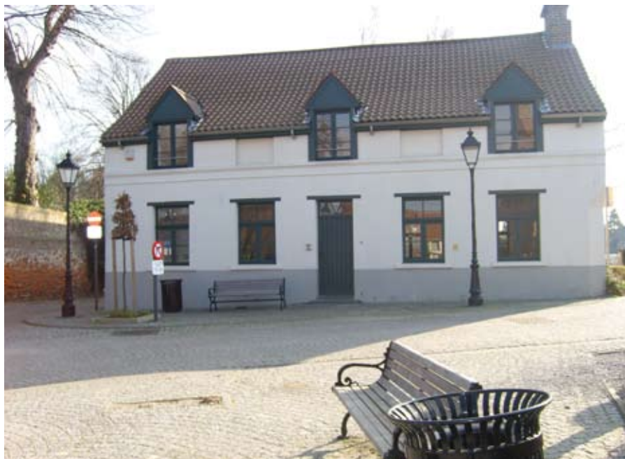
Het Hoeveke is uitgebouwd tot ‘kunst- en cultuurcentrum’.