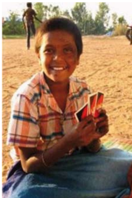
UNO en badminton spelen tijdens Gamesroom.