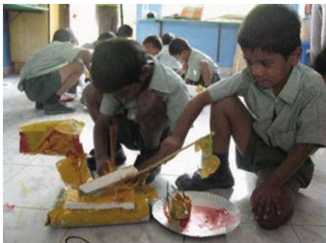
Een boot maken en dan te water laten.

Engels zouden moeten praten... We kunnen gemakkelijk zien wie zijn job als leerkracht serieus neemt en dat zijn er heus niet veel. Van de 10 leerkrachten gaan er volgend jaar 6 weg. Zij willen hun studies afmaken of meer geld verdienen. De school is ook al heel lang op zoek naar een nieuwe leerkracht voor Lower Kinder Garden (LKG, 1ste - 2de kleuterklasje). Deze klas kunnen wij niet nemen, omdat wij geen Telugu (de moedertaal) verstaan. Maar er zijn ook hele leuke momenten: als we een goede uitwisseling hebben gehad over wiskundelessen, als we samen de leraarskamer uitmesten en opruimen