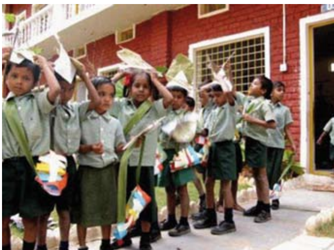
Met onze zelfgemaakte hoed en tas op weg naar het naaicentrum.