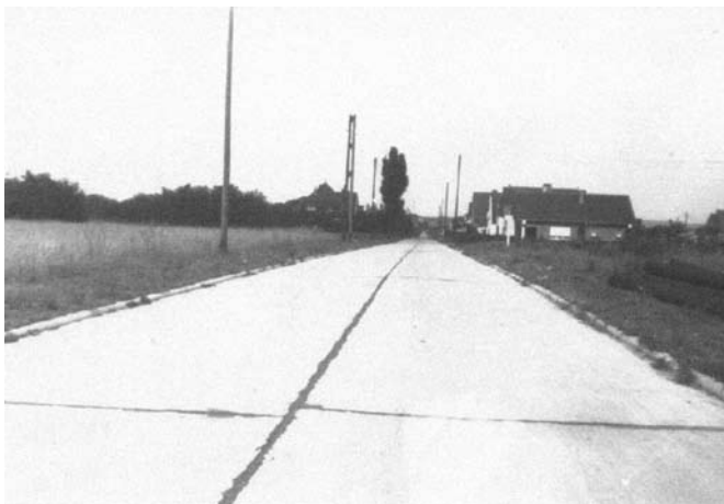
Van lange, smalle veldweg tot Pachthofdreef (rond 1950).

Percelen grond die voor dergelijke activiteiten in aanmerking kwamen, situeerden zich in Wezembeek vooral langs de veldwegen aan de huidige Pachthofdreef, de Gergelstraat en op de Warandeborg. In Oppem was dat vooral langs het sintelbaantje naar het voetbalplein (nu de Sportpleinstraat), de Bosweg, de Hardstraat en de huidige Hertogenlaan. Hierop werden door de gelegenheidshoveniers elementaire gewassen als graan, bieten, rapen en klaveren verbouwd, maar er werden vooral groenten als aardappelen, kolen, wortelen, erwten en bonen op gewonnen. Terwijl de vrouwen tussendoor met hun collega's van de aanpalende percelen of via de achtertuin met de buurtbewoners de laatste spannende wetenswaardigheden van de gemeente uitwisselden, werden de kinderen tegen heug en meug beziggehouden met het eindeloos onkruid wieden tussen de aardappelvoren en het allesbehalve aandachtig lezen van de resterende korenaren op de stoppelvelden. Intussen kapten en krabden de tuinders onverdroten voort. Iedereen, arbeider of bediende, voelde zich een beetje 'boer op zijn akker' en was dan ook terecht fier op zijn welgekomen oogst. Bieten, rapen en klaver gingen naar de huisvrienden, meer bepaald het varken, de geit of het schaap,