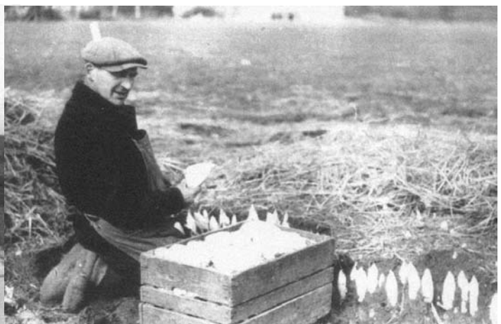
Waare Kiek (E. Cammaerts) 'langt' vers loof.