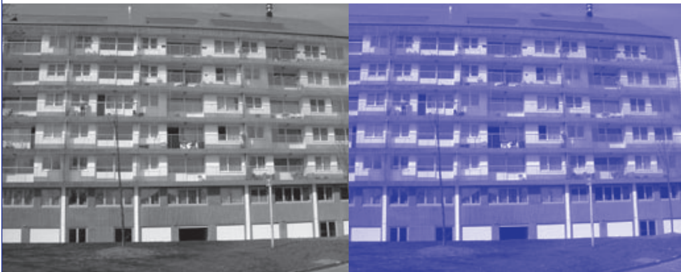
Wezembeek-Oppem is dicht bebouwd. Een voorbeeld daarvan is het appartementsgebouw Ban Eik.

Wat betreft de milieubelasting, dreigt het hele verhaal te eindigen in een smakeloze klucht. Even de voorgeschiedenis: in 1998 werd de belastingaanslag - toen nog 2.500 Belgische frank per gezin - verstuurd met een overtreding op de taalwetgeving. De brieven werden namelijk niet eerst in het Nederlands naar alle inwoners gestuurd. De Democraten van Wezembeek-Oppem (DWO) dienden een klacht in bij de provinciegouverneur, die de belastinginning ongeldig verklaarde. De gemeente inde de belasting in de jaren daarna niet meer, maar liet ze in 1999, 2000, 2001 en 2002 wel inkohieren. De aanslagbiljetten zijn dus nooit verstuurd, maar de inkohiering houdt wel in dat elke