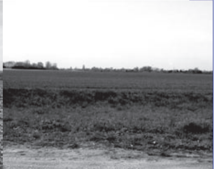
Waardevol gebied langs de Lange Eikstraat.

Een positieve vaststelling op het vlak van milieu, is dan weer dat de gemeente enkele jaren geleden een milieuvaststelling heeft aangeworven. Er is ook een milieuvaststelling (MAR), maar die vergaderingen ontaarden vaak in communautair gehakketak, zodat er niet veel aan beleid wordt gedaan. Regelmatig proberen leden er in het Frans te debatteren, terwijl dat onwettig is. Er worden ook regelmatig mensen in de MAR vervangen, omdat heel wat leden afhaken uit gebrek aan interesse. Op het vlak van milieu lijkt het gemeentelijke beleid zich te beperken tot de aanpak van het vliegtuiglawaai. De steun aan de verschillende actiegroepen door de meerderheid is daar niet vreemd aan. De gemeente ondertekende wel enkele convenanten, maar naast het vliegtuiglawaai valt het milieubeleid wel wat magertjes uit, en dat heeft kwalijke gevolgen. Zo moeten er in Wezembeek-Oppem dringend enkele waterbeheersingswerken