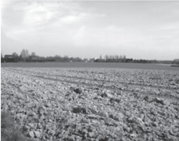
Waardevol gebied het Vurenveld.