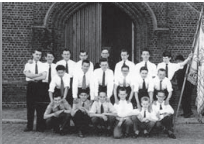
De Kajotters rond 1956.