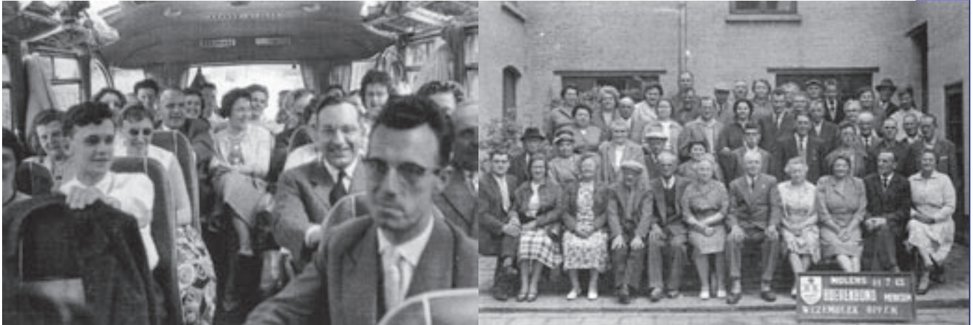
Met het Davidsfonds op reis (1952).