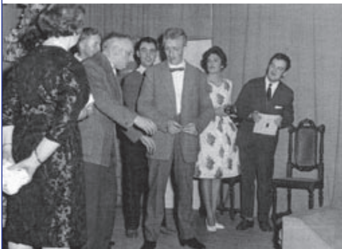
Toneelkring De Morgenster met "Slisse en Cesar" in 1961.