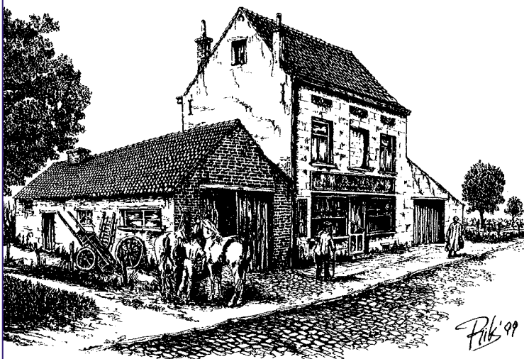
Café 'In 't Smis' aan het gemeentehuis.