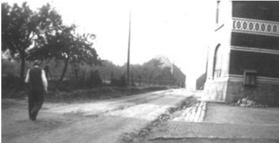
Weide tegenover gemeentehuis ten tijde van de 'mars op Wezembeek' in 1963.

Locatie stripbib Maddox: Jeugdhuis Merlijn, Kerkhofstraat 54, 1970 Wezembeek-Oppem.