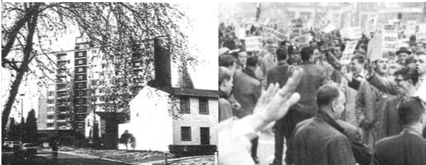
De Ban-Eikwijk (1959).

Tijdens de regering Lefèvre-Spaak (1961-1965) concentreerde de actie van de Vlaamsgezinden zich hoofdzakelijk op de afbakening van de taalgrens en van het tweetalig gebied Brussel. In maart 1961 en oktober 1962 grepen de twee marsen op Brussel plaats, waar massaal betoogd werd tegen eventuele taalfaciliteiten en voor het behoud van de Vlaamse randgemeenten. Hierbij ontpopten de anders zo joviale en ruimdenkende Brusselaars zich, met de steun van de lijdzaam toeziende ordediensten, tot bekrompen en agressieve tegenbetogers, die onder meer aan het Brusselse Beursgebouw hun Vlaamse landgenoten op scheermesjes verpakt in gekookte aardappelen trakteerden, hen bedachten met een spontane Hitlergroet en hen begroetten met tientallen pancartes 'Keer (sic) naar uw dorp'. Waren zij maar in hun 'Capitale' gebleven... Als jeugdige deelnemer aan deze betogingen stelde ik vast dat het recht op betogen in de Belgische hoofdstad voor de Vlamingen