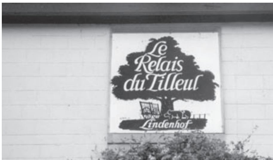
Uithangbord 'In de Meiboom' (thans 'Le Relais du Tilleul').