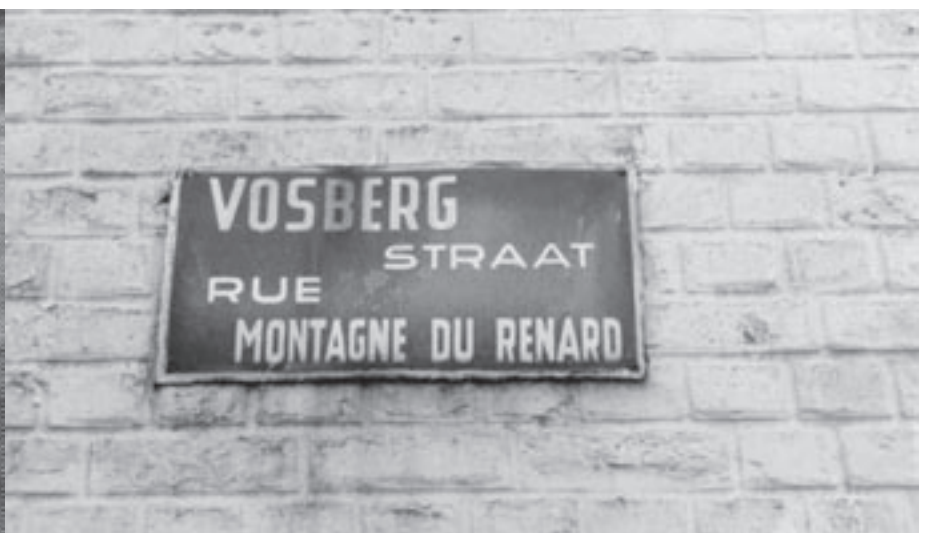
Straatnaambord met taalfaciliteiten daterend van voor 1963.