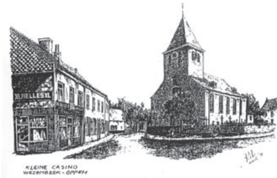
'In de Kleine Casino'.