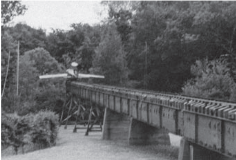
V1 of vliegende bom op lanceerramp