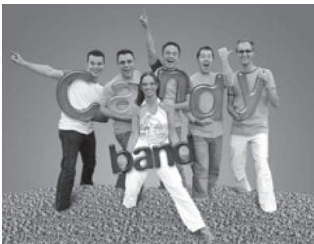
Candy Band treedt op zaterdag 2 juli om 15u op.

Een goede raad: stel je inschrijving niet uit tot morgen, want de vorige jaren was de cursus snel volgeboekt.