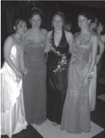
De dames in galakleding.

Verenigde Staten. Daarna gaan we drie dagen met de eindejaars op 'seniortrip' naar de Ozarks, een groot merengebied in Missouri, de staat ten zuiden van Iowa. Op het programma staan onder andere jetskiën en parasailing. Op zondag 22 mei studeer ik officieel af van de Amerikaanse high school. Er is een grote ceremonie gepland met van die lange zwarte kleren en vierkante hoedjes die in de lucht gegooid worden, zoals je ook wel eens in Amerikaanse films ziet. Voor mij zal dit ook de dag zijn dat ik vele medeleerlingen voor de laatste keer zal zien.