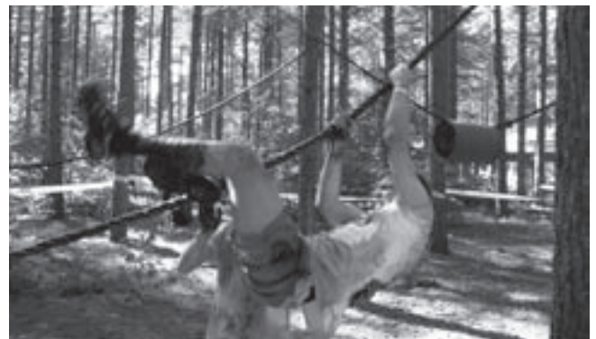
Het avonturenparcours aan gemeenschapscentrum de Moelie in Linkebeek.

Meer info en inschrijvingen bij de plaatselijke gemeenschapscentra en bij het Gordelsecretariaat, Dorpsstraat 43, 1640 Sint-Genesius-Rode, tel. 02 380 44 44, e-mail degordel@bloso.be . Kijk ook op www.bloso.be