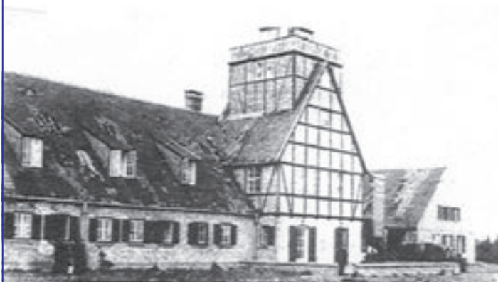
De controletoeren van het militair vliegveld van Melsbroek (zie vierkante toeren in het dak).

Tijdens zo'n luchtgevecht overdag raakte 'Stalin', een van onze twee katten, zodanig in paniek dat hij als een zwarte duivel voor mijn ogen zonder enige moeite in één enkele poging over een betonnen tuinmuur van ongeveer 2,5 meter sprong. Het waren echter vooral de nachtelijke bombardementen die bij de Wezembekenaars een onvergetelijke indruk nalieten. Het aanzwellend gebrom van de aanvallende vliegtuigen ontketende onmiddellijk een uitzinnig gehuil van de loeiende sirene, die zich op het dak van het gemeentehuis bevond en met de hand bediend werd.