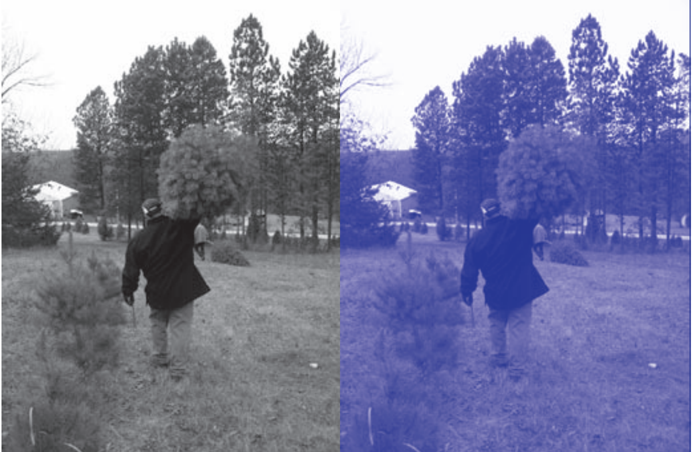
Zelf een kerstboom kappen in een bos.

daar een boom hebben omgehakt. Nee, het is een bos, vol met kerstbomen, uitgebaat door een privé-persoon. Je loopt rond in dat bos, kiest een boom, hakt die om en betaalt de uitbater. Afhankelijk van de grootte plakt de uitbater een prijs op de boom. Na het hakken, was er natuurlijk het versieren. De buitenversiering is er bij ons nog niet, maar vele huizen in de buurt hangen al vol met kerstlichtjes. Heel mooi om te zien!