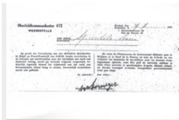
‘Staatsblad’ tijdens de Duitse bezetting.

De Duitsers hadden van de omgeving rond het station een verboden zone gemaakt. Ze was afgesloten met prikkeldraad. Ze waren er vrij gerust in, want de bewaking ervan werd tijdens de hele bezettingsperiode toevertrouwd aan één enkele schildwacht, zijnde ‘soldaat Hans’. Het betrof een gemoedelijke veertiger, gedrongen van postuur en lichtjes mankend. Hij was duidelijk niet sterk gemotiveerd bij het uitoefenen van zijn bewakingsopdracht en kwam elke dag zijn pintje drinken in het café van het gezin Ameye tegenover de Sint-Pieterskerk. Hij droeg steeds zijn geweer, dat van een ouder type was en