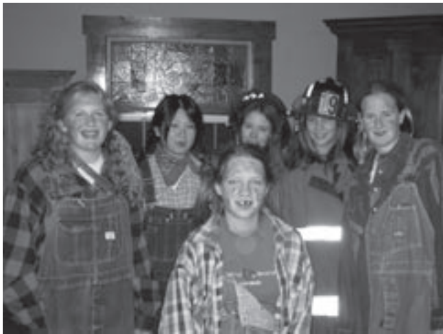
Op 30 oktober vierden ze halloween.

waren natuurlijk de presidentsverkiezingen van 2 november. Je kon er niet naast kijken: kranten, journaals, televisiedebatten... alles pulde ervan uit. Ook in Leon waren er in vele tuinen borden aangebracht met ofwel Bush-Cheney ofwel Kerry-Edwards. Wij Europeanen hebben een totaal ander beeld van Bush dan de mensen hier. Voor ons zou het ondenkbaar zijn om Bush te herkiezen. Hier niet! Ondanks de oorlog en de vele doden geeft hij de Amerikanen een goed gevoel; ze zijn terug de baas van de wereld! Door hier te leven en via gesprekken op mijn school vermoedde ik dat Bush ging winnen.