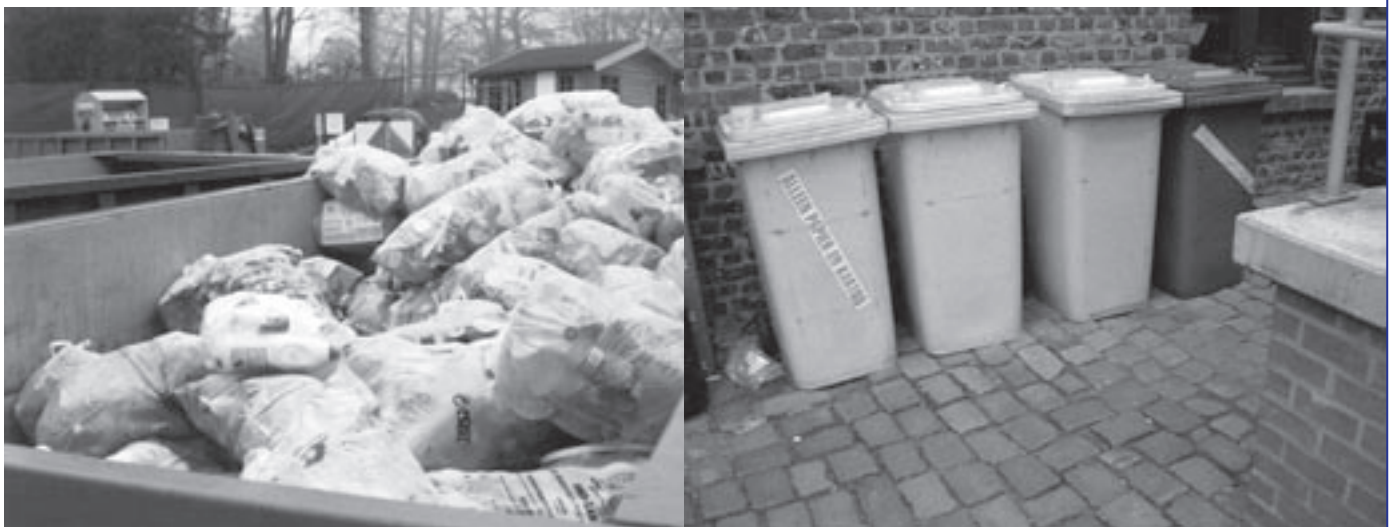
Nieuwe regeling over afvalophaling wordt goedgekeurd.

Apotheek De Coster Mechelsesteenweg 225 1933 Sterrebeek 02 731 23 66