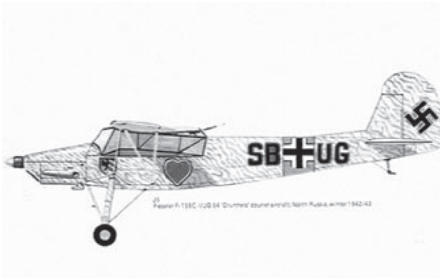
Estafettevliegtuig type Fieseler Storch.