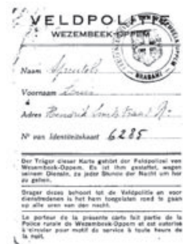
Toelating om 's nachts buiten te komen.