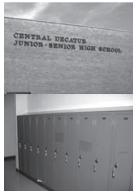
De typische 'lockers' voor alle persoonlijke spullen.