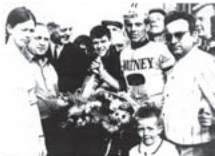
Wielervedstrijd voor beroepsrenners van de Sportvrienden (1971).