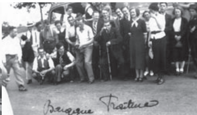
VTB-uitstap naar Baraque Fraiture (1938).

Bij het aantreden van koning Leopold III was de economische situatie er nog steeds niet op verbeterd en gingen er stemmen op voor een regering van nationale eenheid. Op 18 maart 1935 zag de eerste regering Van Zeeland (1935-1936), waarin de drie grote politieke partijen vertegenwoordigd waren, zich verplicht een forse devaluatie van de Belgische frank door te voeren.