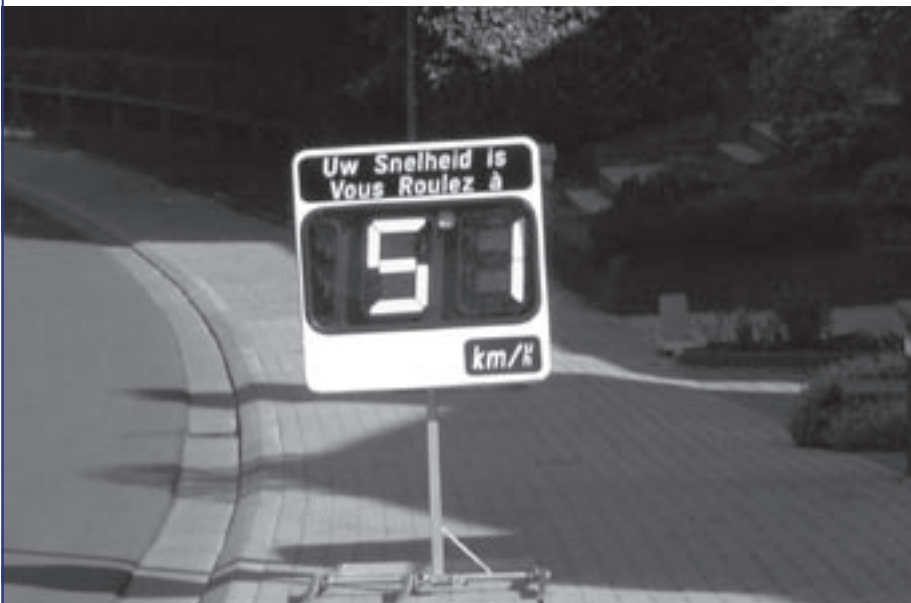
Verplaatsbare snelheidsborden moeten autobestuurders aanzetten hun snelheid te matigen.