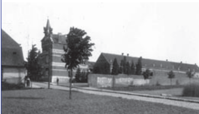
Kiesstrijd te Wezembeek met slogan 'Rex vaincra' op de schoolmuur in de L. Marcellisstraat (1936).