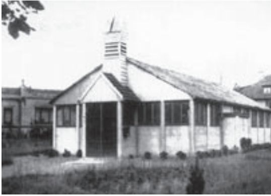
Geprefabriceerde kapel in de Bel-Airwijk (1939)

parlement in semi-corporatistische zin 'de orde en het gezag' dienden te herstellen en te handhaven. Na de stellingname van de bisschoppen in 1937 tegen ieder autoritair regime werd ook de 'Fédération des Cereles' uitgeschakeld.