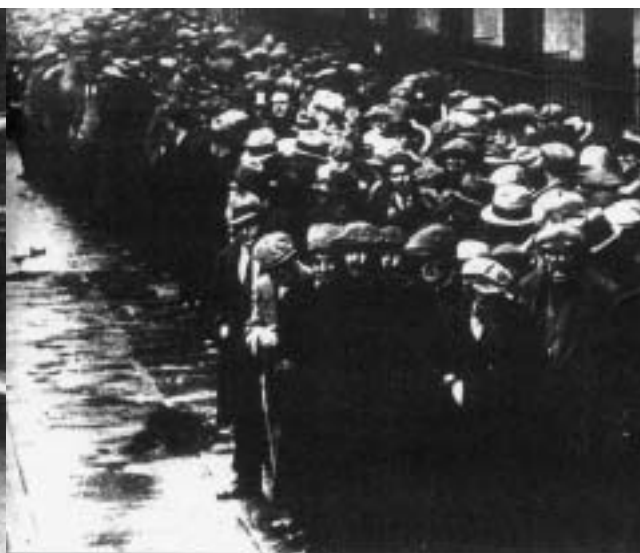
Werklozen in de rij (1934).

In 21 jaar tijd (1919-1940) waren er maar liefst achttien regeringen. Het Franstalig liberaal en katholiek contrarevolutionair traditionalisme bleef evenwel tot geen enkele toezegging op sociaal-democratisch vlak bereid; dit terwijl de kapitalistische economie, maar ook de burgerlijke democratie, door de depressie werd belaagd. Terwijl de pauselijke encycliek Quadragesimo Anno (1931) een nieuwe impuls aan het corporatistisch ideeëngoed had gegeven, volgden de vakbonden, ondanks een sterke syndicalisatiegraad bij de arbeiders van grote ondernemingen en in de openbare sector, een voorzichtige reformistische politiek, die het bestaand economisch systeem geenszins bedreigde. Massale fabriekssluitingen en geweldadige stakingen volgden elkaar aan een hels tempo op. In de jaren '30 bestond de overgrote meerderheid van de 350.000 werklozen uit Vlamingen. Financiële tegenslagen zoals het faillissement van de socialistische Bank van de Arbeid en de Algemene Bankvereniging (met ondermeer