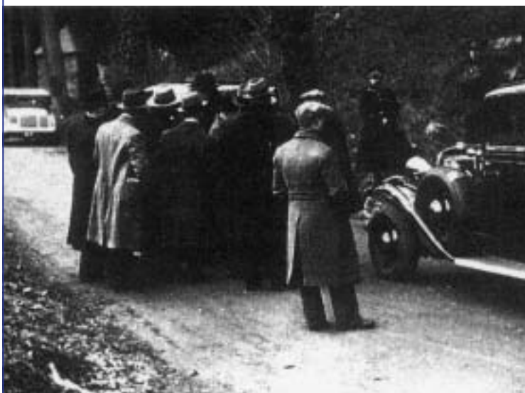
Onderzoek door het parket te Marche-les-Dames (1934).