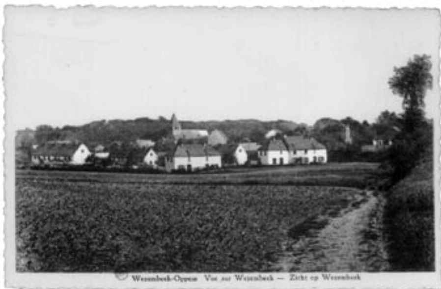
Sociale woonwijk H. Smetsstraat.