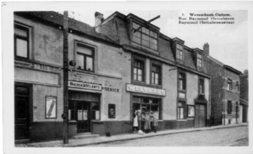
Welvaartwinkel en zaal Ons Huis.