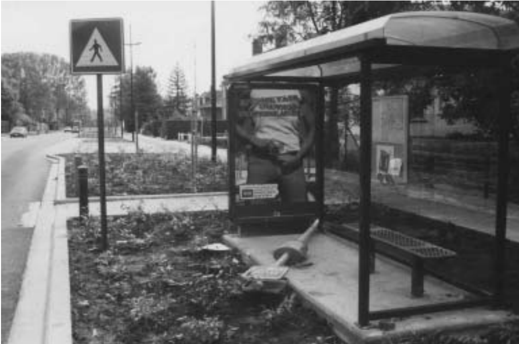
Wezembeek-Oppem: ceci n'est pas un 'buskot'

• De Vlaamse overheid heeft de achttien gemeenten aangeschreven, die door de Gordel worden aangedaan. Ze wil de route permanent bewegwijzeren. Wezembeek-Oppem weigerde schriftelijk te antwoorden op de vraag om wegwijzers te mogen plaatsen. Mondeling liet de gemeente weten dat ze geen toestemming geeft om de wegwijzers te plaatsen. Waarom eigenlijk? In de route zit nu een hiaat op het grondgebied Wezembeek-Oppem. Vervelend voor de fietsliefhebbers. Maar ook een beetje kinderachtig. Was dat een beslissing van het college?, wil DWO weten. Want in de notulen is daarover niets