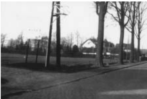
De Mechelsesteenweg tussen Oppem en Sterrebeek (1920)

gen Albrecht en Isabella reeds in 1617 de weg van hun paleis te Brussel naar het jachtslot in Tervuren aanzienlijk te verbeteren. Deze weg werd de 'Prince-Wegen' genoemd en maakte de huidige Hertogenweg (Tervuren) en Hertogweg en Hertogenlaan (Oppem) uit, die Stokkel dwarste en via de François Gaystraat en de Hertogenstraten (Sint-Pieters-Woluwe) over Oudergem en Etterbeek aan de Naamse Poort en het Hof op de Coudenberg in Brussel uitkwam.