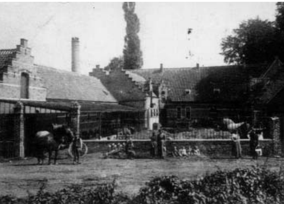
Het pachthof van Heistvoorde met molen en melkerij (rond 1900)

Daar het verkeer door onze contreien uitermate lastig verliep, besloten de aartsherto-