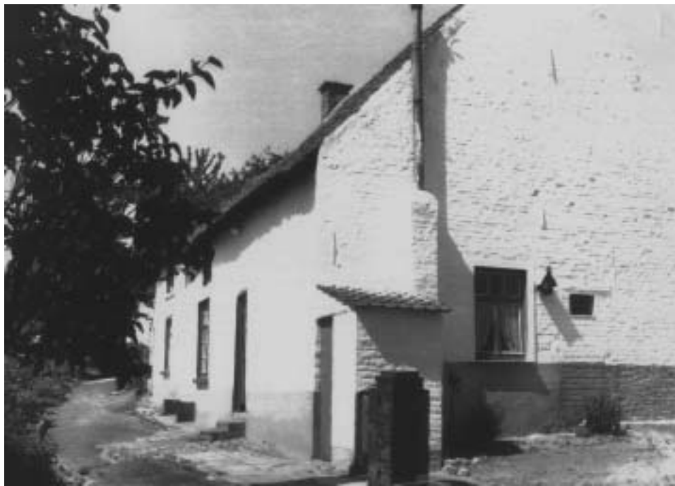
Witgekalkt boerenhuisje aan de bergenblok (2003)

De provinciale Mechelsesteenweg, die de verbinding tussen Mechelen en Waterloo verzekert, werd in 1840-1843 aangelegd en in 1882 werd de spoorweg Brussel-Tervuren gerealiseerd. Vanaf 1958 zet de Maatschappij voor het Intercommunaal Vervoer dagelijks