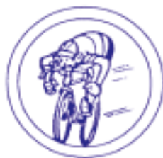
V.Z.W.D. KONINKLIJKE WIELERCLUB "DE SPORTVRIENDEN"

Het weekblad 'De Bond' is het bindmiddel tussen alle leden.