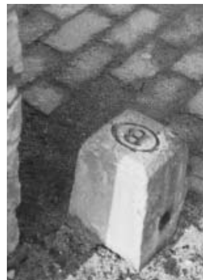
Grenspaal NMBS langs spoorweg aan Mechelsesteenweg te Oppem (2003)