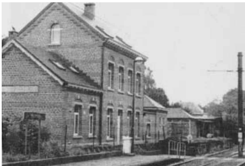
Station Stokkel aan de Burburelaan (1950)

In 1882 werd de spoorlijn Brussel-Leopoldswijk-Oudergem doorgetrokken tot Tervuren. Op het Wezembeekse traject werden drie stations gebouwd. Eén aan de weg naar Stokkel (halte Wezembeek-Stokkel), één aan de Mechelsesteenweg (halte Oppem) en het eindstation tussen de Hertogweg en de Brusselsesteenweg (huidig nummer 17 in de Albertlaan). Naar aanleiding van de 'Exposition internationale de Bruxelles' werd in 1897, op aandringen van Koning Leopold II, dit laatste vak omgelegd naar het latere Koloniënpaleis (Congomuseum) en het park, met een nieuw eindstation aan de Leuvensesteenweg op het grondgebied van Wezembeek. In elk station werd een stationschef aangesteld, die er met zijn gezin woonde. De stationschef van Oppem was ook postmeester. Het oversteken van de trein aan de wegen nabij de haltes werd oorspronkelijk door barelen op rails, later door slagbomen beveiligd. Er waren barelen aan de Mechelsesteenweg en aan de Molenweg.