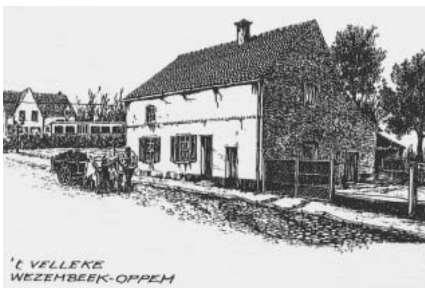
L. Marcellisstraat met halte Veldeken op de achtergrond (1950)