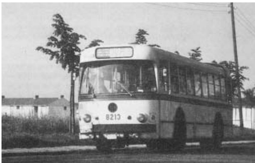
Bus nr. 30 aan de wijk Ban Eik (rond 1970)