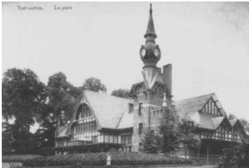
Station Tervuren aan de Leuvensesteenweg (1930)