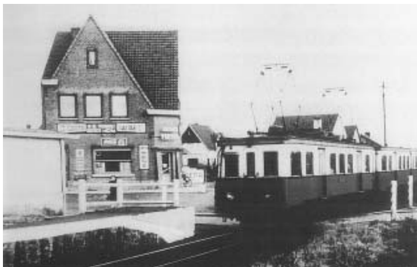
Station Wezembeek aan de L. Marcelisstraat (1950)

In 1882 werd de spoorlijn Brussel-Leopoldswijk-Oudergem doorgetrokken tot Tervuren. Op het Wezembeekse traject werden drie stations gebouwd. Eén aan de weg naar Stokkel (halte Wezembeek-Stokkel), één aan de Mechelsesteenweg (halte Oppem) en het eindstation tussen de Hertogweg en de Brusselsesteenweg (huidig nummer 17 in de Albertlaan). Naar aanleiding van de 'Exposition internationale de Bruxelles' werd in 1897, op aandringen van Koning Leopold II, dit laatste vak omgelegd naar het latere Koloniënpaleis (Congomuseum) en het park, met een nieuw eindstation aan de Leuvensesteenweg op het grondgebied van Wezembeek. In elk station werd een stationschef aangesteld, die er met zijn gezin woonde. De stationschef van Oppem was ook postmeester. Het oversteken van de trein aan de wegen nabij de haltes werd oorspronkelijk door barelen op rails, later door slagbomen beveiligd. Er waren barelen aan de Mechelsesteenweg en aan de Molenweg.