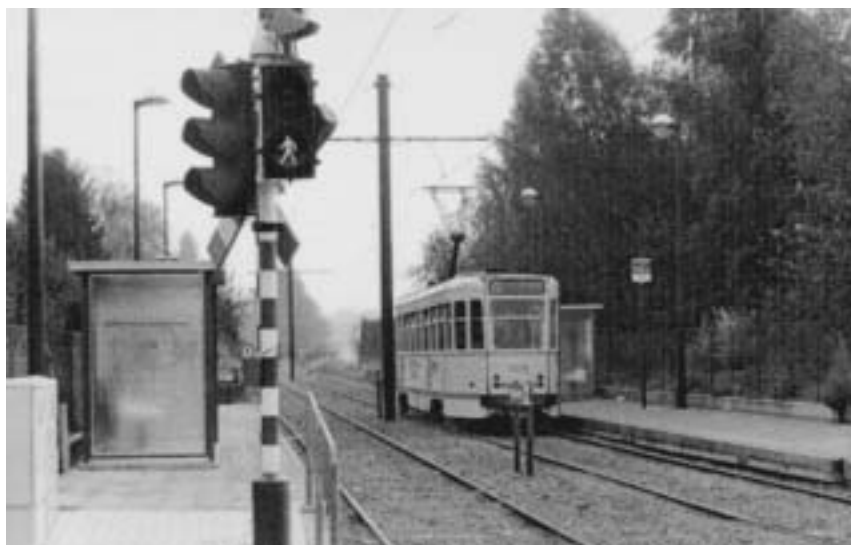
Sneltram 39 MIVB aan halte Marcelis (1988)

om. Kwam daarbij nog de niet aflatende obstructiepolitiek van het Ministerie van Verkeerswezen, waarbij iedere aanvraag tot tariefverhoging vanwege de BT-lijn werd vertraagd en waardoor de maatschappij hopeloos achterop raakte tegenover haar rechtstreekse rivalen NMBS (Nationale Maatschappij Belgische Spoorwegen) en MIVB (Maatschappij Intercommunaal Vervoer Brussel). Bovendien rijfde de NMBS, steeds in toepassing van het oorspronkelijk concessiecontract, de lucratieve pakjesdienst van de BT-lijn terug binnen.