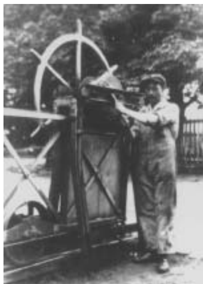
Bareelwachter (rond 1930)