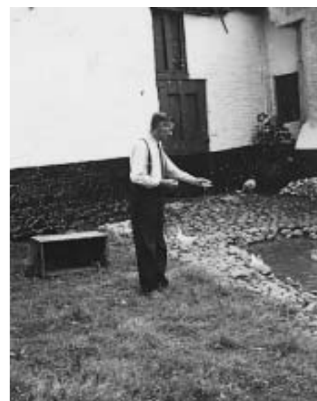
De bron van De Kam.