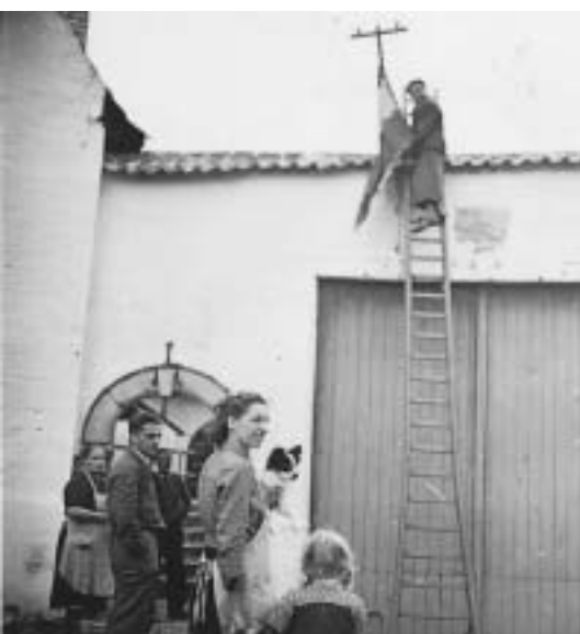
De vlag gaat omhoog om de bevrijding te vieren, 1945.