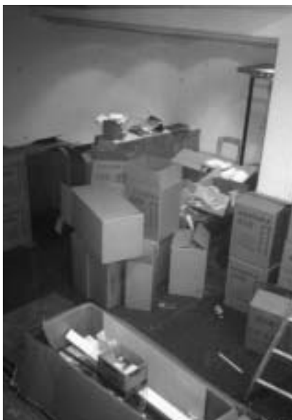
Kartonnen dozen met allerhande rommel werden vakkundig weggemoffeld voor de opening.

Elk jaar een optreden met een andere muziekstijl; gebracht door een internationale artiest als eminente vertegenwoordiger van die bepaalde stijl. Een geniaal idee, al zeggen we het zelf. Sinds 1998 maakt De Kam kennis met een minder frequent geprogrammeerde muziekstijl. Bedoeling is iets