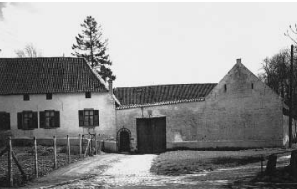
De Kamme in 1950.

Soeterwey met drankhuis op de Varkensmarkt, de kamme van de hofstede Buda met herberg op de Kaamberg en de kamme in het Begardenklooster (thans kasteel de Grunne).