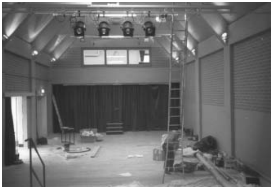
De grote zaal enkele uren voor de officiële opening op 19 februari 1993.

Dat de Vlamingen kunnen feesten is bekend; dat De Kam daar nog een