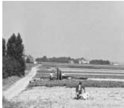
Het Rot met midden op achtergrond villa 'La Quiétude', 1932.