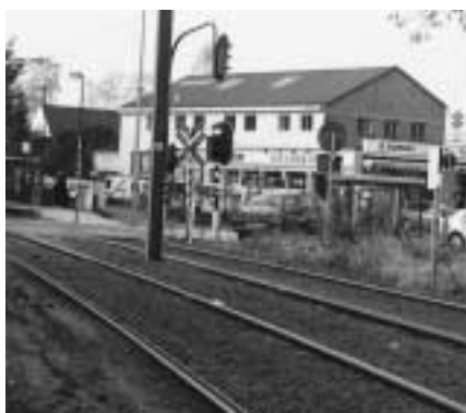
Halte van tram 39 van de MIVB aan de Mechelsesteenweg, 2002.