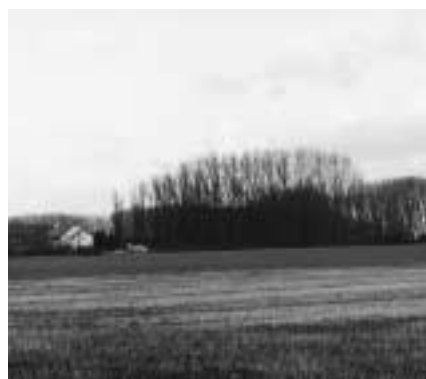
Resterend deel van Het Rot, gezien vanaf de Oudergemseweg. Op de achtergrond links boxen van de renbaan van Sterrebeek, 2002.