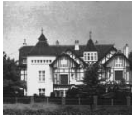
Villa 'La Quiétude'. Thans appartementsgebouw en woonef, 1932.