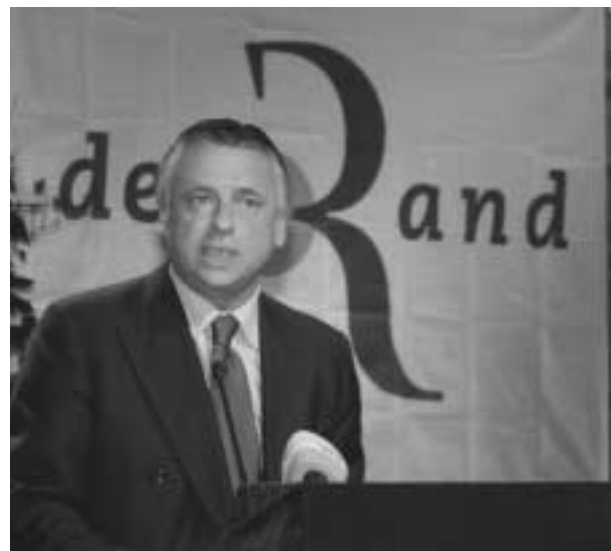
Patrick Dewael: "De faciliteiten moeten uitdoven."

De taalfaciliteiten zijn een typisch Belgisch compromis. Door in 1963 dit stelsel in te voeren werden de uiteenlopende standpunten in de communautaire strijd verzoend, legde prof. dr. Els Witte uit, en kon de politiek zich verder bezighouden met de sociaal-economische problemen. Voor de Vlamingen was het belangrijk dat het tweetalige Brussel tot de 19 gemeenten beperkt werd en dat de taalgrens vastgelegd werd. De Franstaligen zagen in de faciliteiten een regeling die nauw aansloot bij Brussel om er na verloop van tijd in op te gaan. "De volgende compromissen in de opeenvolgende staatsvormingen gingen verder op dit uitgangspunt, al werd het administratief steeds duidelijker dat de zes faciliteitengemeenten tot het Nederlandstalig gebied behoren. In 1988 werden de faciliteiten grondwettelijk verankerd. Het al