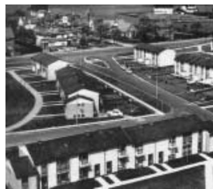
De sociale woonwijk Ban Eik aan de Mechelsesteenweg, 1960.