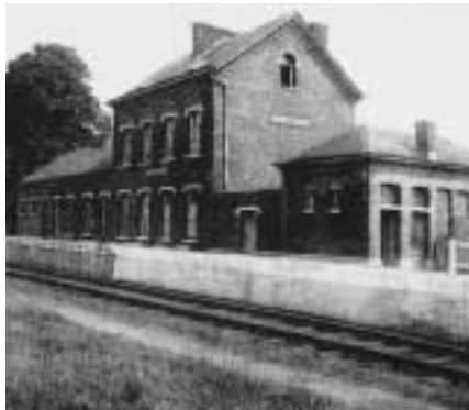
Station van Oppem met bareelhuisje 1930.