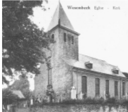
De Sint-Pieterskerk (1925)