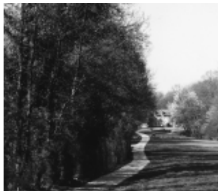
Het kasteel de Burbure met park in 2002

Secretariaat vzw 'Het Anker': J.B. De Keyzerstraat 108, 1970 Wezembeek-Oppem.