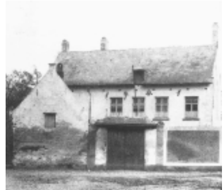
De pastorie van 1741

• De weg nr. 8 van de Wegenatlas, 'Kerkomgang' genaamd en door het volk 'Kerkplaats' geheten, kreeg de benaming Sint-Pietersplein bij raadsbesluit van 22 juli 1948. De in het midden van het plein gelegen parochiekerk is immers aan de Heilige Petrus in banden of boeien gewijd. De hagiografie van Sint-Pieter verhaalt dat de boeien waarmee hij in Jeruzalem en Rome was vastgeketend, door tussenkomst van een engel afvielen, en dat de heilige vrij de gevangenis kon verlaten.