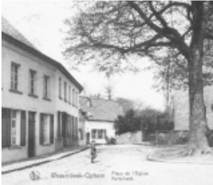
Sint-Pietersplein (1925) met als laatste woning op eerste rij rechts De herberg Sint-Pieter (stichtingslokaal harmonie St. Cecilia) en helemaal rechts op de achtergrond het vroegere kostershuis.