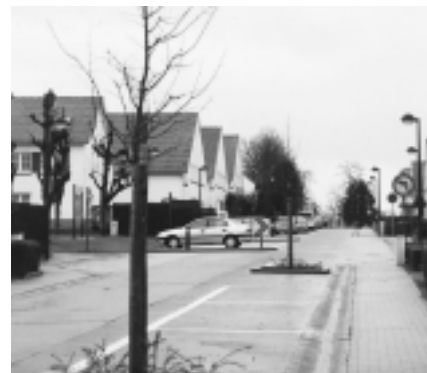
Heldenlaan in 2002