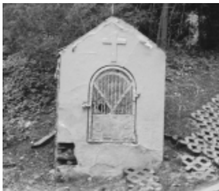
Kapelletje van de Heilige Antonius op de Vosberg

• De Kloosterlaan: (straatbenaming omwille van haar ligging tegenover het klooster van de paters passionisten), de Mechelsesteenweg, de Oudergemseweg en de Windmolenstraat kruisen de Vosberg. Op de hoek van de Oudergemseweg en de Vosberg staat een vervallen kapelletje, toegewijd aan de Heilige Antonius.