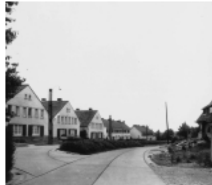
Vosberg anno 1960