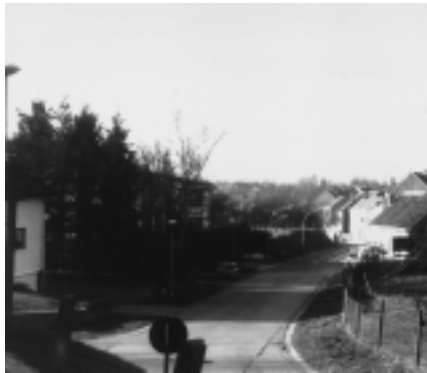
Kruispunt Van Severlaan/Krommestraat/ Vosberg anno 1960