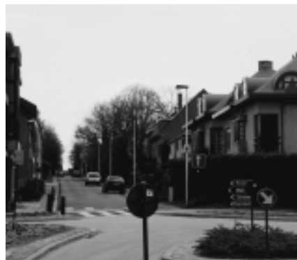
Van Severlaan in 2002