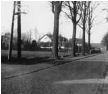
Kruispunt Leopold III-laan/Mechelsesteenweg rond 1935