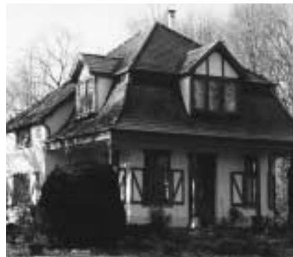
Villa in vooroorlogse cottage-stijl aan de Grensstraat in 2001