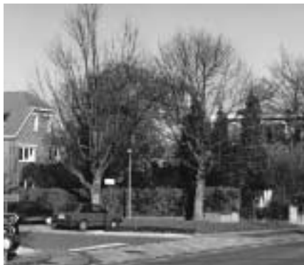
Kruispunt Leopold III-laan/Mechelsesteenweg rond 2001

- Museumstraat: Deze straat ligt tegenover het Museum voor Midden-Afrika in Tervuren en vormt de grens tussen die gemeente en Wezembeek-Oppem. Vroeger heette ze ook Molenstraat. De straatnaam Molenstraat werd op de gemeenteraad van 20 mei 1977 gewijzigd in Museumstraat om verwarring met de Molenweg te voorkomen.