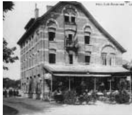
'Hotel-Café-Restaurant La Vignette' aan de Grensstraat in 1930

- Leopold III-laan: Na de troonbestijging van Koning Albert I in 1934 werd de benaming Leopold III-laan gegeven aan het deel van de oude Dieweg tussen de Krommestraat en de Grensstraat.