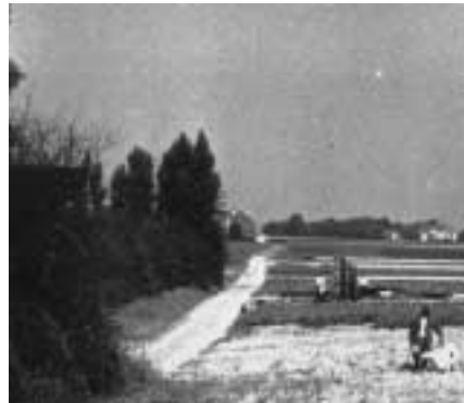
Leopold III-laan voor Wereldoorlog II