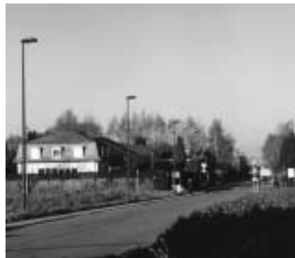
Leopold III-laan in 2001